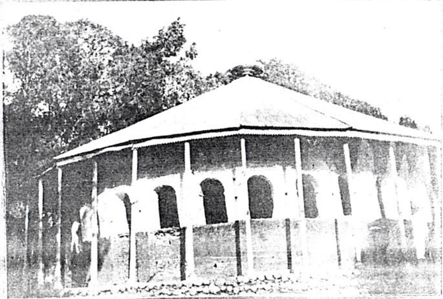
በሸዋ ዐ ስብከት በሰላሌ አውራጃ ፍቺ የሚገኘው ሸንኩርኑ ሃይብረ ጸሃን ት ሚካኤል ቤተ ክርስቲያን